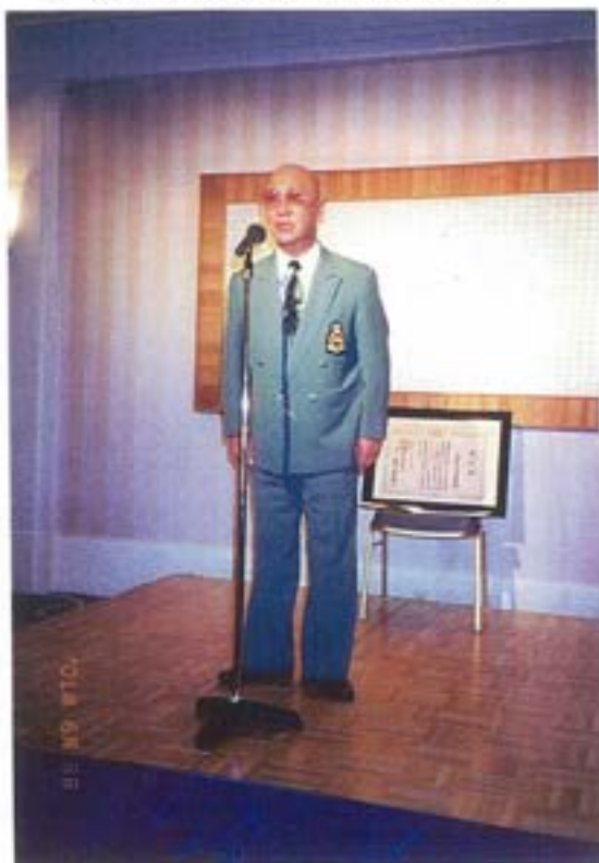
(重厚な歴史を語る石井相談役)

年明け早々の1月8日(成人の日)、日本武道協議会より「平成12年度・武道優良団体」として表彰された事を記念して、第19会定期総会が開催された6月3日(日)の夕刻より、浦和ワシントンホテルに於いて記念祝賀会が盛大に開催された。