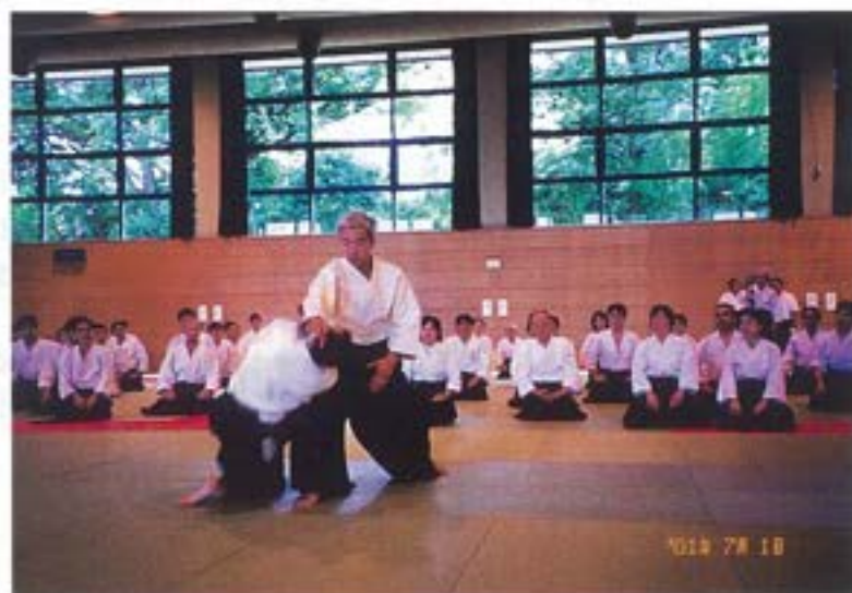
(道主に集る参加者の熱い視線)