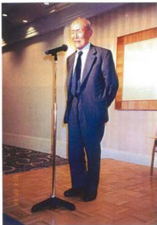
(好々爺か水戸黄門？中島相談役)