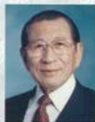
全日本合気道連盟 会長 綿貫民輔

新年おめでとうございます。 関係者の皆様におかれましては希望に満ちた新年を、清々しいお気持ちでお迎えになられた事と存じます。